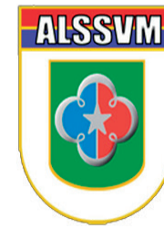
Área de Lazer dos Subtenentes e Sargentos da Vila Militar – Exército