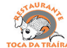
Restaurante Toca da Traíra