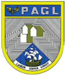
Prefeitura de Aeronáutica do Galeão