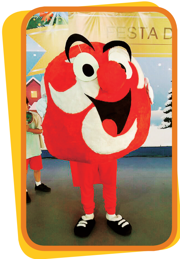
Nosso mascote da alegria

A Colônia Mania possui um portfólio com várias atividades: