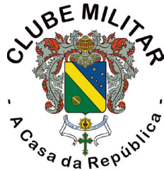
Clube Militar da Lagoa