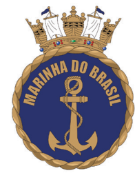
Casa do Marinheiro (MARINHA DO BRASIL)